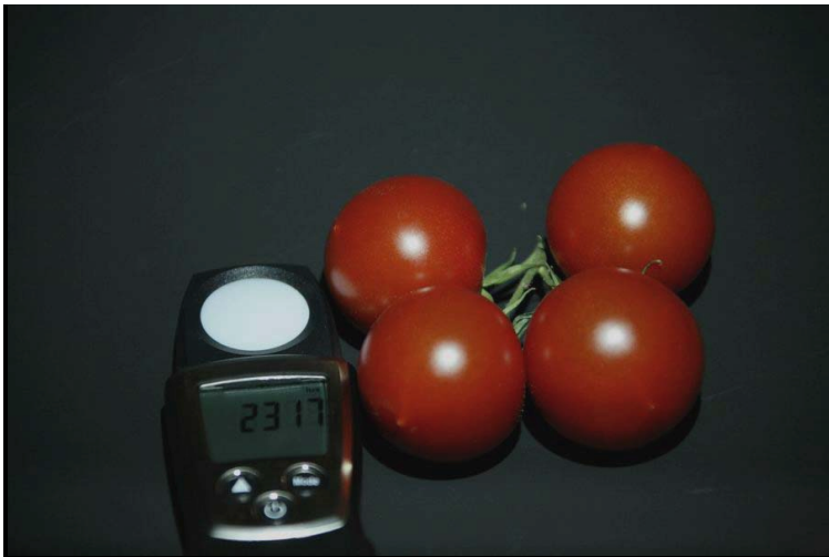
LED 7x Warmweiß 5500 K (HID 10W)